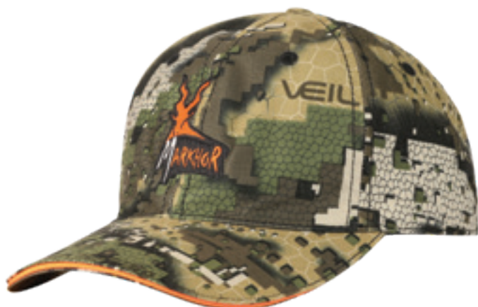
Casquette réglable et tissu déperlant.