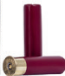
Chevrotines cuivrée affrontant plus de dureté aux grains pour une meilleure pénétration