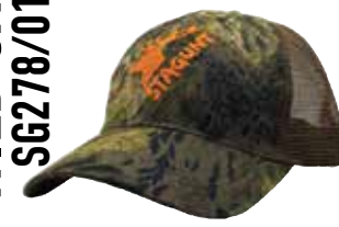
WILD CAP SG278/012