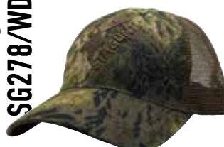
WILD CAP SG278/WDC