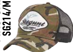
MAC CAP SG214/MC