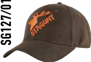
PEISEY CAP SG127/012