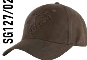
PEISEY CAP SG127/022